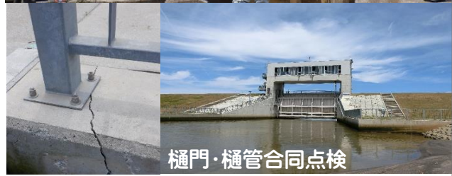
樋門・樋管合同点検