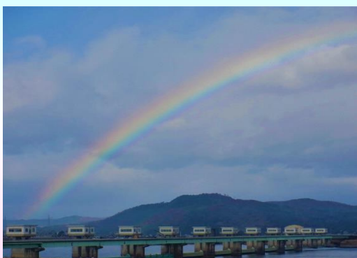
阿武隈大堰に虹がかかったよ♪

夏は、気象の変化が激しいよ。XRAINで要確認だっちゃ☆ 上流で大雨が降ると下流は晴れていても、急に大水が押し寄せるよ。 山の方が暗くなったり、ゴミ混じりの黒い水が流れて来たり、入道雲 が出て来たら危険！川から離れてね☆