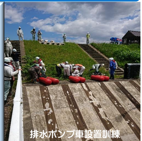
排水ポンプ車設置訓練

今回の点検や巡視で早急に 修繕が必要な箇所はありませ んでしたが、最近地震が多く、 コンクリートに割れ目が入っ てしまった箇所等もみうけら れましたので、そんな場所は 注意深く経過観察を続け、順 番に修復いたします。